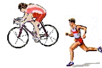
Langlauf oder Fahrrad